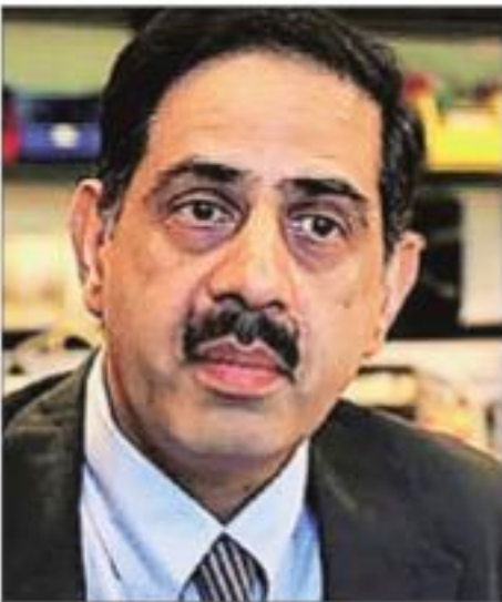
Balram Bhargava, director general, ICMR

On the progress of Covid-19 vaccines, Union health secretary Rajesh Bhushan said the Zyqus Cadila's Covid-19 vaccine ZyCoVd had been given Emergency Use Approval and would come in the Covid-19 vaccination programme. The price at which the vaccine would be procured was under discussion with the manufacturer, he said. “As it is a three-dose vaccine and it comes with a needle-less delivery system it would have a differential pricing that the existing vaccines that are in the Covid vaccination programme,” Bhushan said.