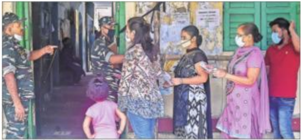
Voters show their identity cards before entering a polling booth to cast their vote during Bhabanipur by-polls, in Kolkata, on Thursday